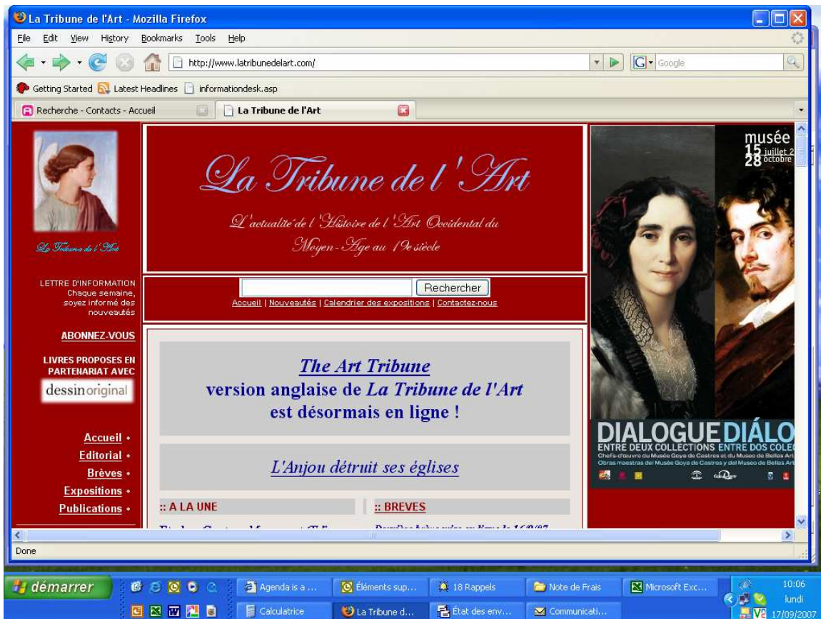
Homepage features extract of article (with click through to the text) – see below